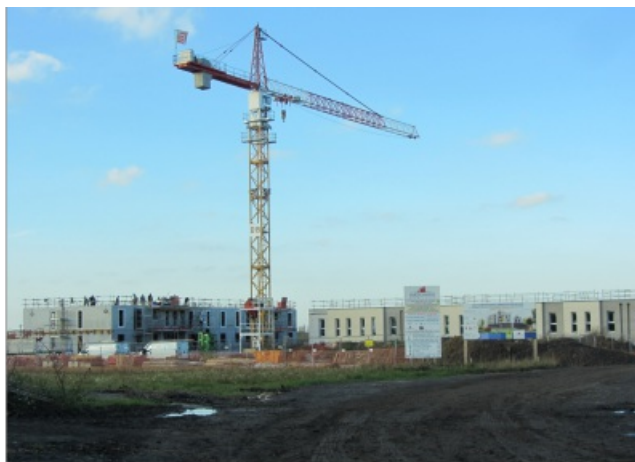
Logements en construction.